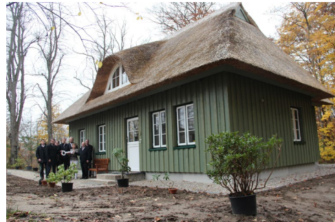
Schlüsselübergabe nach Fertigstellung

Sehr erfreulich war, dass die neue Pellet-Heizung (sowie der dazu erforderliche Lagertank) für das Hausmeistergebäude und das eigentliche Jagdschlösschen mit Mitteln aus der zuständigen Aktiv-Region gefördert wurden. Die Mittelauszahlung erfolgte in 2013.