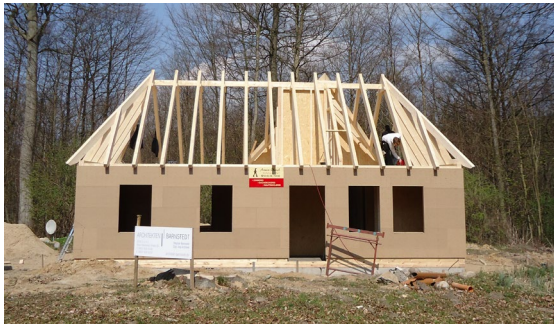
Ansicht des Rohbaus

Die beabsichtigten planerischen Vorhaben konnten in 2012 zwar vollständig umgesetzt werden. Nicht zu halten war die terminliche Planung. Statt Mitte 2012 konnte das neue Hausmeistergebäude erst Ende 2012 fertig gestellt werden. Auch der Einbau einer neuen Heizung für das neue Gebäude sowie für das Jagdschlösschen verzögerte sich.